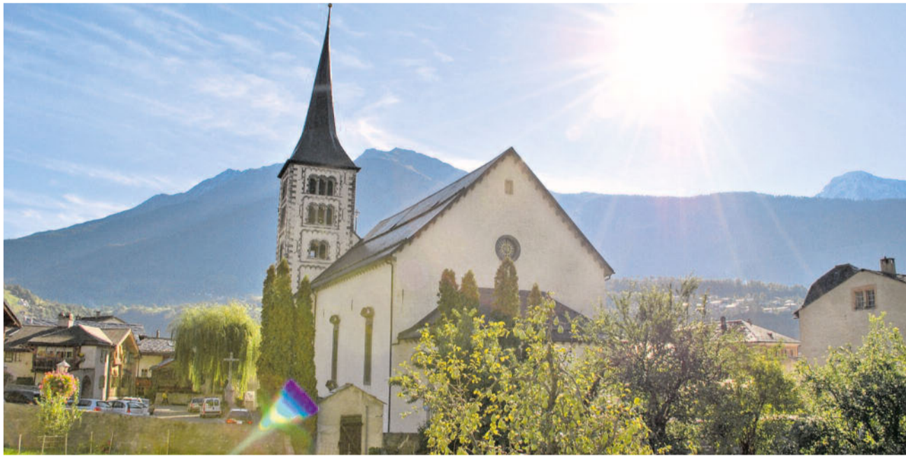
Scheidung. Die Gemeinde Naters will sich in Zukunft an die Aletsch Arena anlehnen, anstatt weiterhin mit Brig Belalp Tourismus zusammenzuspannen.

Dass man in Naters mit Brig Belalp Tourismus das Heu nicht immer auf der gleichen Bühne hatte, ist hinreichend bekannt. Nun verlässt man den unliebsamen Partner. Den Entscheid zum Austritt bei Brig Belalp Tourismus traf der Natischer Gemeinderat an seiner Sitzung vom 22. April. Und zwar einstimmig. Man sei zum Schluss gekommen, dass die Erwartungen, die seinerzeit bei der Gründung von BBT ausschlaggebend für einen Beitritt waren, aus Sicht der Gemeinde und auch aus der Sicht der Leistungsträger auf der Nordseite nicht erfüllt seien. Zunächst werde man nun mit verschiedenen Partnern zusammenarbeiten, die ähnliche Produkte anbieten und die gleichen Märkte bearbeiten. In einer zweiten Phase wolle man sich eng an die Aletsch Arena anlehnen. | Seite 3