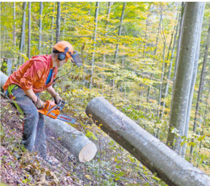
Harte Arbeit. Forstarbeiter leiden oft vergleichsweise früh an den gesundheitlichen Folgen ihres Metiers.

Forstwärte leben gefährlich. Aufgrund körperlicher Beschwerden gibt es nicht viele über 40-jährige Waldarbeiter.